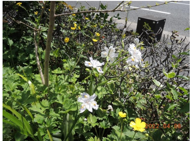
シャガとキンポウゲ